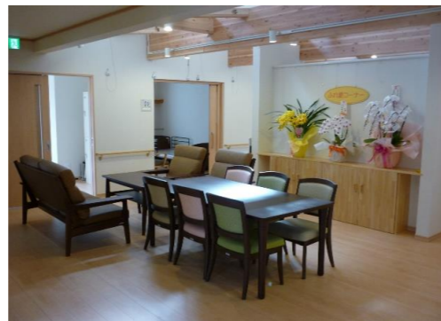
地域交流スペース

ふれ愛では、認知症の方へのケアを、少人数による家庭的な雰囲気の中で、日常生活における様々な場面でご利用者の方に参加していただき、共に共同生活を送ります。それによって、認知症の症状の緩和することが出来ます。